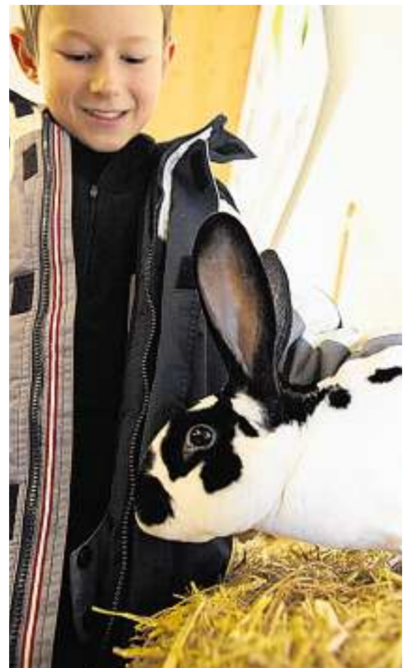
Teddy-Ersatz: Die Rassen Rex Castor (Mitte) und Rex Dalmatiner (rechts) sind mit ihrem weichen Fell die Kuscheltiere unter den Kaninchen, während der Heuhase wohl weniger kuschelig ist.