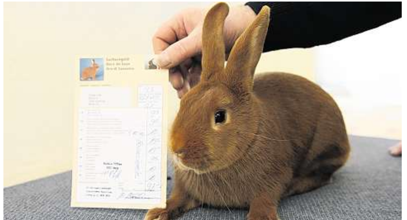
Stolzer Sieger: Dieses Sachsengold-Kaninchen erzielt mit seinen 97 Punkten den Rassesieg.

Insgesamt kämpften 316 Aussteller aus der ganzen Südostschweiz um diverse Preise und den Rassesieg ihrer Tiere. Die höchste erreichte Punktzahl bei den Kaninchen war 97,5 von möglichen 100 Punkten. Bewertet wurden etwa Haltung, Körperbau sowie Fellfarbe und Fellzeichnung der Kaninchen. Oberste Priorität jeder Bewertung hat jedoch immer die Gesundheit des Tieres. (so)